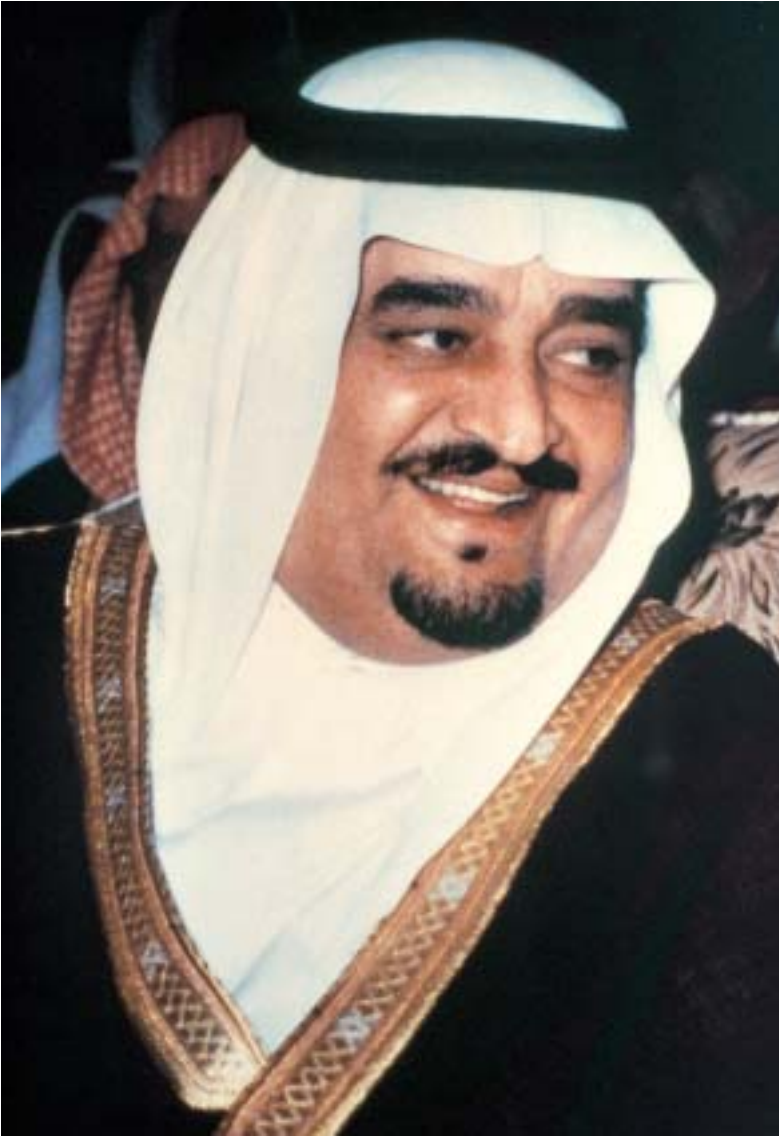
二聖モスクの守護者 ファハド・ビン・アブドルアジーズ・アール・サウード国王