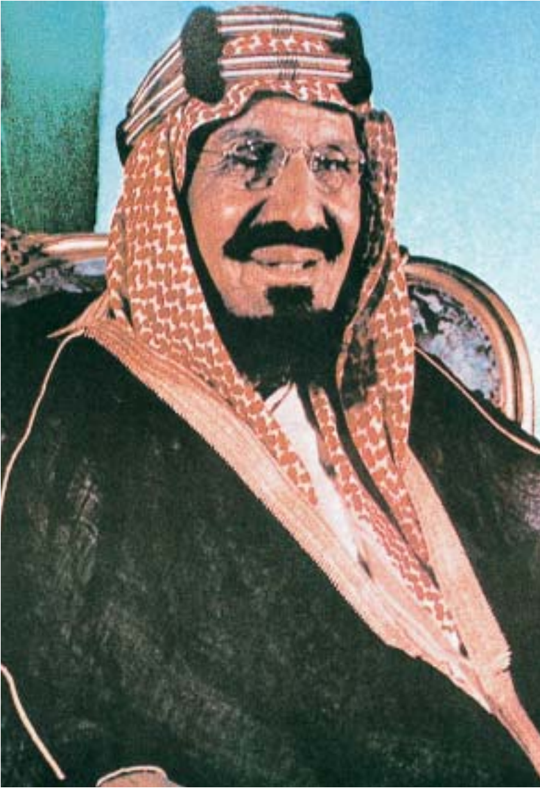
サウディアラビア王国建国の祖 アブドルアジーズ・ビン・アブドッラハマーン・アール・サウード国王