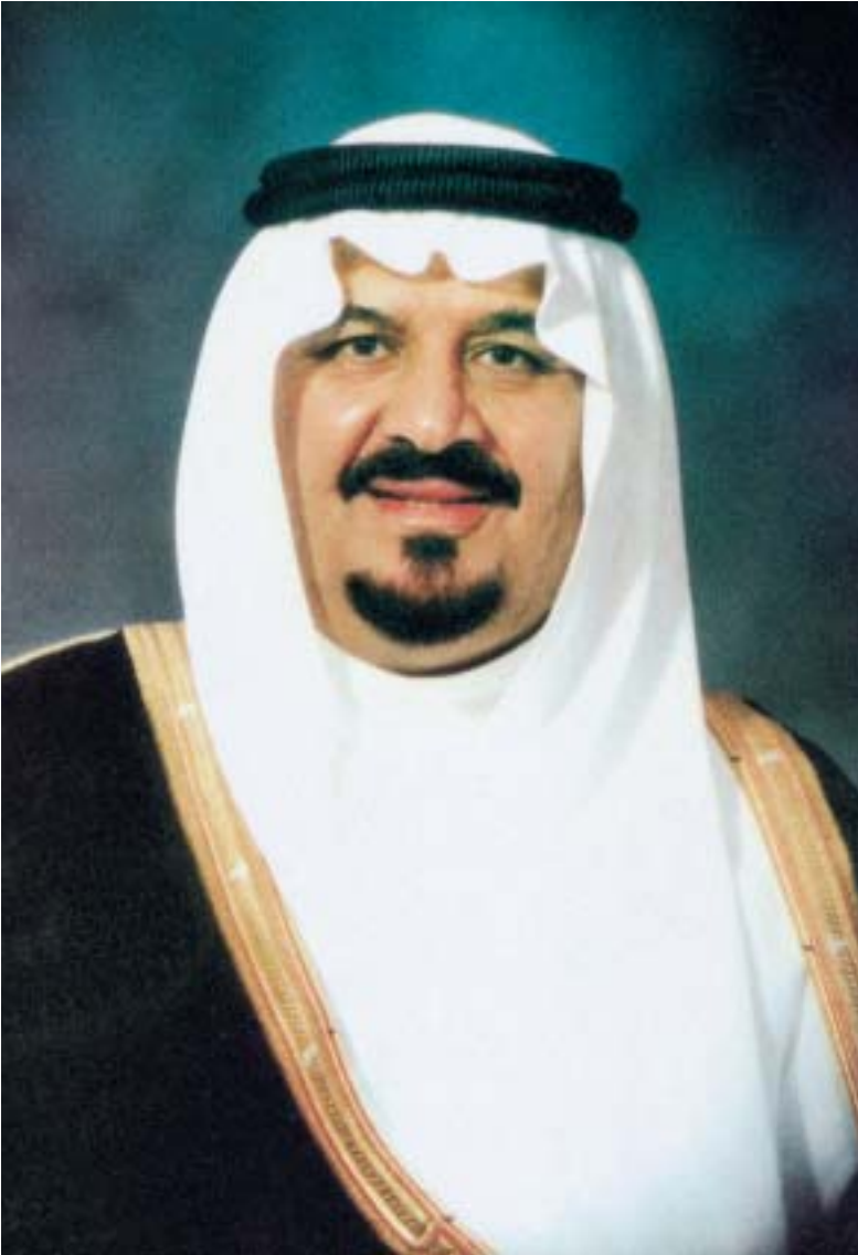
第二副首相兼国防・航空相兼監察長官 スルターン・ビン・アブドルアジーズ・アール・サウード殿下