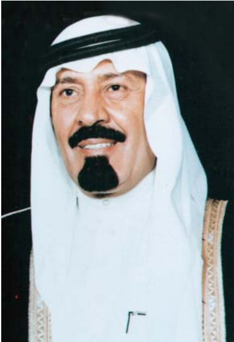
皇太子兼副首相兼国家警備隊司令官 アブドッラー・ビン・アブドルアジーズ・アール・サウード殿下