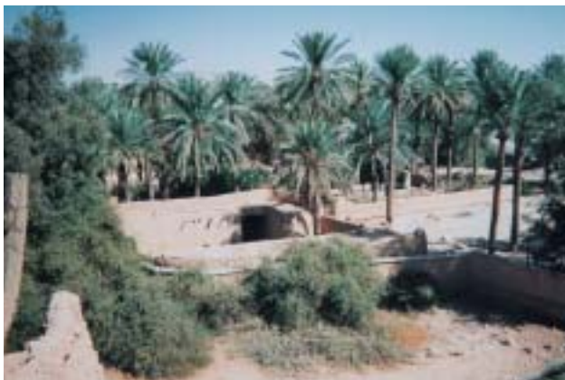
サウード王家発祥の地、ディルイーヤ（リヤード）